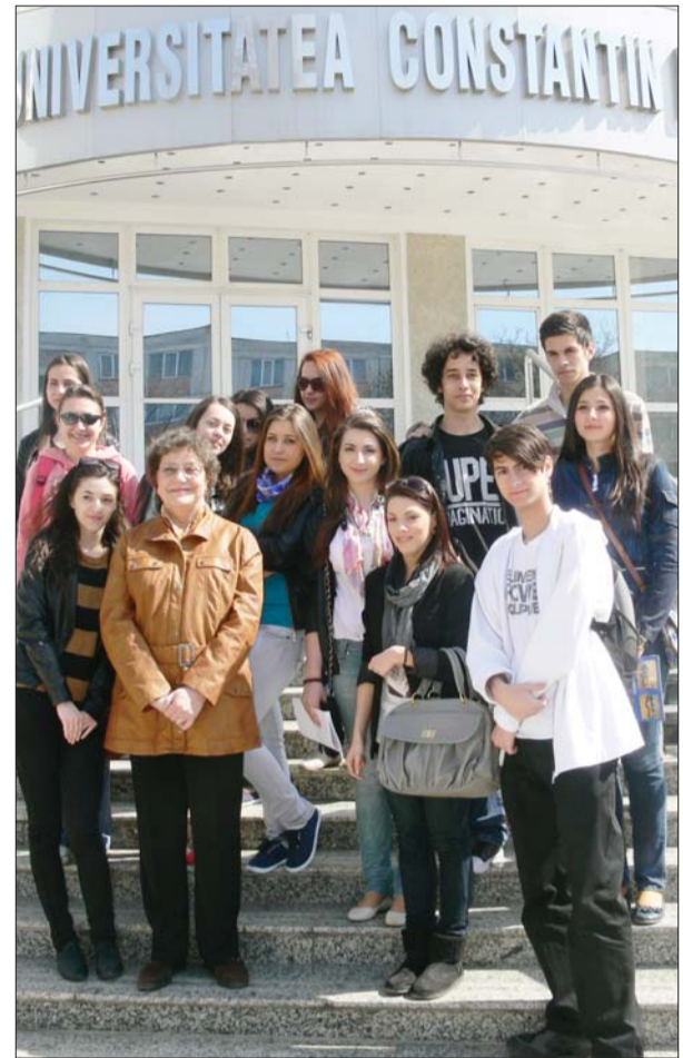
Un scurt shooting înainte de începerea evenimentului