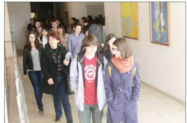
În drum spre...