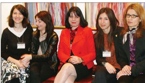
Cea mai zâmbitoare echipă de organizare