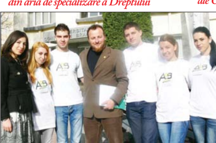
Studentii Erasmus le-au povestit elevilor despre altfel de experiențe – mobilitățile de studiu și de practică în Europa oferite de UCB