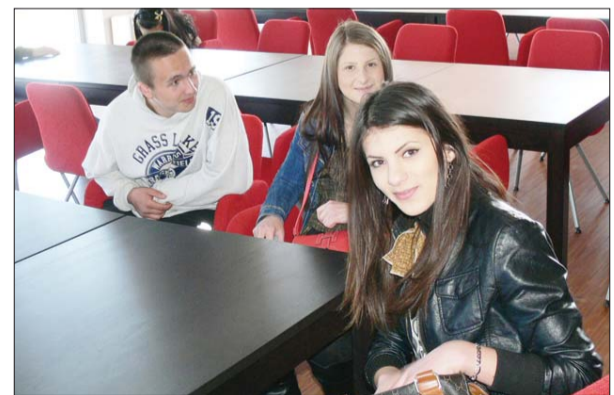
... spațioasa și colorata bibliotecă