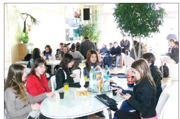
La final, o pauză binemeritată la Zabrano Cafe!