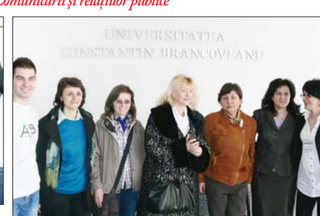
Și profesorii sunt altfel pe parcursul acestei săptămâni