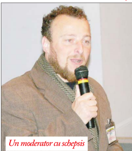
Un moderator cu schepsis

Curioși să aștepte cât mai multe despre profesiile prezentate sau despre... cât de bine au ieșit în poză!