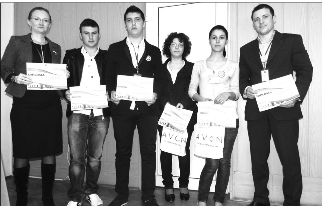
▲ Elevii și profesorii ai Liceului Economic „Petre S. Aurelian” Brăila, inițiatori ai FE „PSA CONSTRUCT” SRL