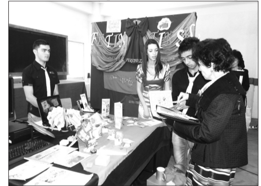
▲ Membrii juriului analizează oferta FE „TINTIN” S.R.L., echipa Colegiului Economic din Buzău