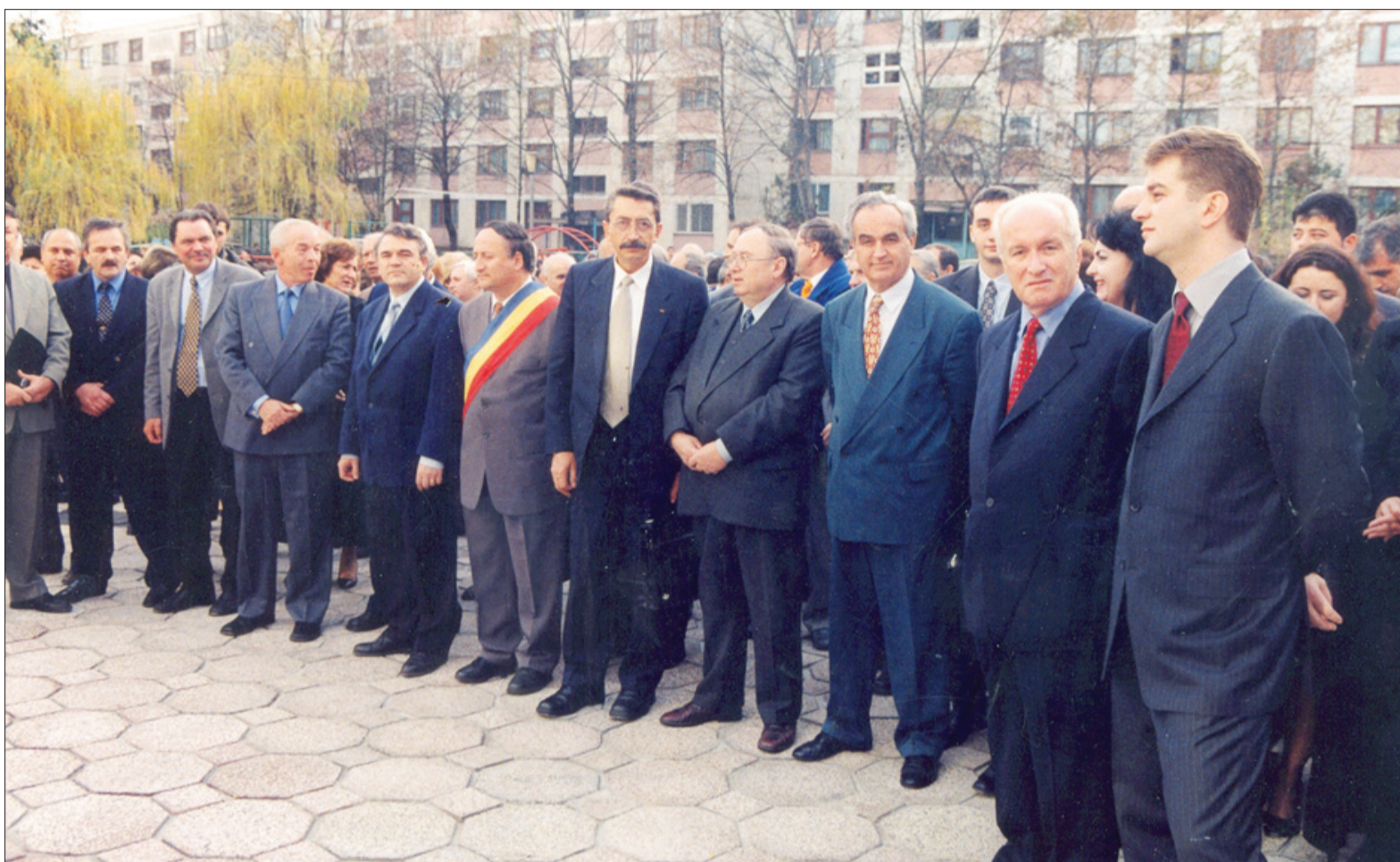
Moment aniversar la Universitatea Constantin Brâncoveanu