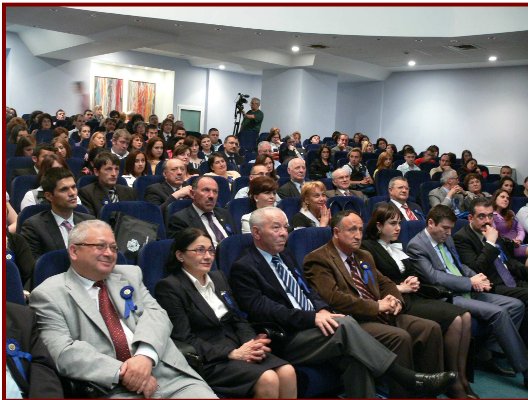
20 de ani de învățământ superior la UCB