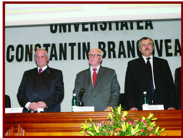
Festivitatea de înmânare a certificatului cu calificativul „Grad ridicat de încredere” de către ARACIS