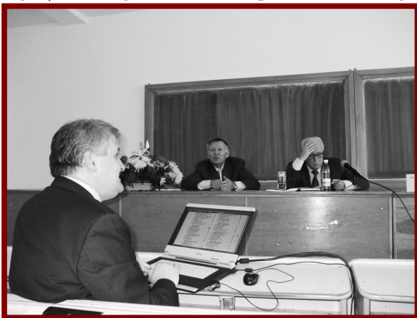
Simpozionul Internațional dedicat Zilei Mondiale a Siturilor Ramsar, la UCB Brăila