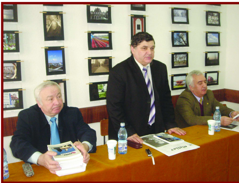
Seminar de consiliere în carieră la Universitatea Constantin Brâncoveanu, Rm. Vâlcea Imaginea personală - cheia succesului în procesul de recrutare

Universitatea Constantin Brâncoveanu a fost din nou gazdă, la Brăila, a unui eveniment organizat în parteneriat cu Universitatea de Stat din Moldova și Asociația Culturală Livada, Brăila. Astfel, vineri, 25 martie, în cadrul ciclului de manifestări intitulat Identități social-culturale contemporane , a avut loc dezbaterea cu tema Convergențe spirituale Chișinău - Brăila; 93 de ani de la unirea Basarabiei cu România . Prima activitate în programul zilei a fost lansarea volumului Jurnalismul politic, între corectitudine și partizanat , volum conținând o colecție de lucrări și articole prezentate în cadrul conferinței cu același titlu, ce a avut loc cu câteva luni în urmă. Lansarea s-a desfășurat în sala de lectură a bibliotecii universității, cu participarea reprezentanților Facultății de Jurnalism și Științele Comunicării de la Chișinău, a cadrelor didactice și a studenților FSAC, Brăila.