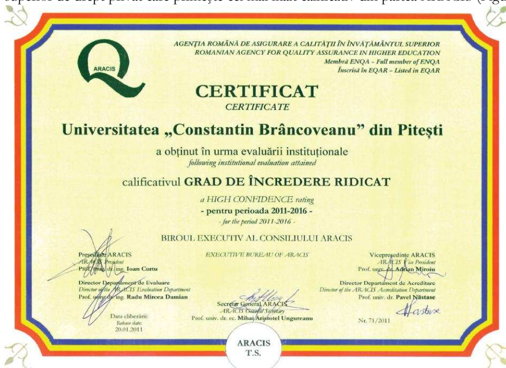
Figura nr. 1. Certificatul ARACIS de obținere a calificativului „grad de încredere ridicat”

În luna noiembrie 2010, Universitatea „Constantin Brâncoveanu” din Pitești a primit vizita unei misiuni a Agenției Române de Asigurare a Calității în Învățământul Superior (ARACIS), pentru evaluare instituțională externă. Scopul evaluării instituționale externe a fost acela de a certifica măsura în care Universitatea „Constantin Brâncoveanu” din Pitești pune în aplicare valorile de referință ale Procesului Bologna, exercitându-și misiunea de a oferi programe de educație, formare profesională de nivel universitar și postuniversitar și participă la realizarea Spațiului European al Cercetării Științifice, prin obținerea unor rezultate la nivel de excelență în domeniul cercetării științifice. Consiliul ARACIS a hotărât, în luna ianuarie 2011, acordarea calificativului „Grad de încredere ridicat” pentru Universitatea „Constantin Brâncoveanu” din Pitești, instituția noastră fiind a treia instituție de învățământ superior de drept privat care primește cel mai înalt calificativ din partea ARACIS (Figura nr. 1).